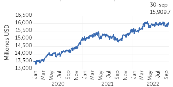
Gráfico 3. Depósitos del sector privado

“Los depósitos de bancos, bancos cooperativos y SAC representan un 90.9% del total de las fuentes de fondeo”