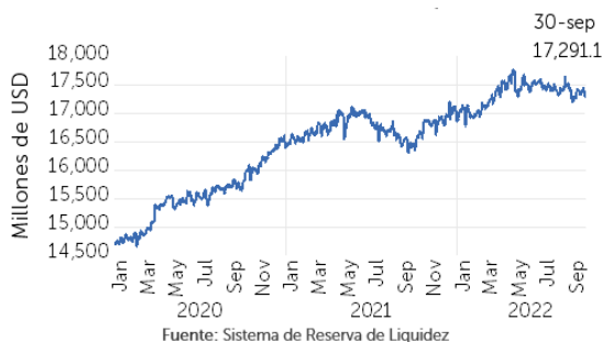
Gráfico 2. Evolución de depósitos

Los depósitos privados registraron un saldo de USD 15,909.7 millones, manteniendo la tendencia estable, mientras, los depósitos públicos muestran un saldo de USD 1,381.4 millones, experimentando una tendencia a la baja a partir de mayo 2022, retornando a los valores previos a la inyección de recursos para atender los efectos de la pandemia durante 2020 y 2021