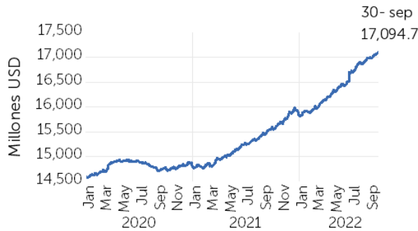
Gráfico 1. Evolución de préstamos

Al 30 de septiembre del 2022, los préstamos brutos de los bancos, bancos cooperativos y sociedades de ahorro y crédito (SAC) totalizaron USD 17,094.7 millones, reflejando un crecimiento interanual de USD 1,493.5 millones, equivalente a 9.6%