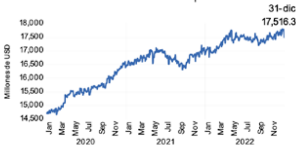
Gráfico 1. Evolución de préstamos

Al 31 de diciembre del 2022, los préstamos brutos de los bancos, bancos cooperativos y sociedades de ahorro y crédito (SAC) totalizaron USD 17,516.3 millones, reflejando un crecimiento interanual de USD 1,688.3 millones, equivalente a 10.7% (Gráfico 1).