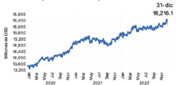
Gráfico 3. Depósitos del sector privado

“Los depósitos de bancos, bancos cooperativos y SAC representan un 85.3% del total de las fuentes de fondeo”