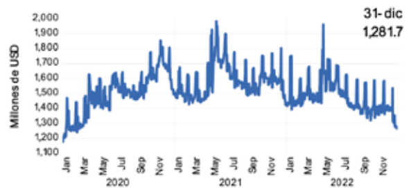
Gráfico 4. Depósitos del sector público

Las condiciones de liquidez se mantienen con niveles adecuados y estables con una ratio de préstamos a depósitos de 100.1%, muestra de la estabilidad y solvencia del Sistema Financiero.